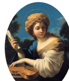
Giovanni Francesco Romanelli Sainte Cécile Rome vers 1645-1650

UNE VERSION INÉDITE DE LA SAINTE CÉCILE DE GIOVANNI FRANCESCO ROMANELLI Une œuvre en scène DU 15 OCTOBRE AU 13 NOVEMBRE 2011