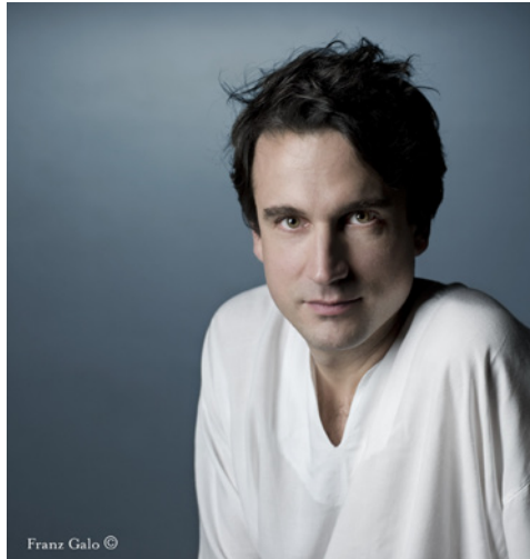
Franz Galo

Renseignements et réservations : Tél. 04 75 91 83 65 Réservations internet : http://chateaux.ladrome.fr