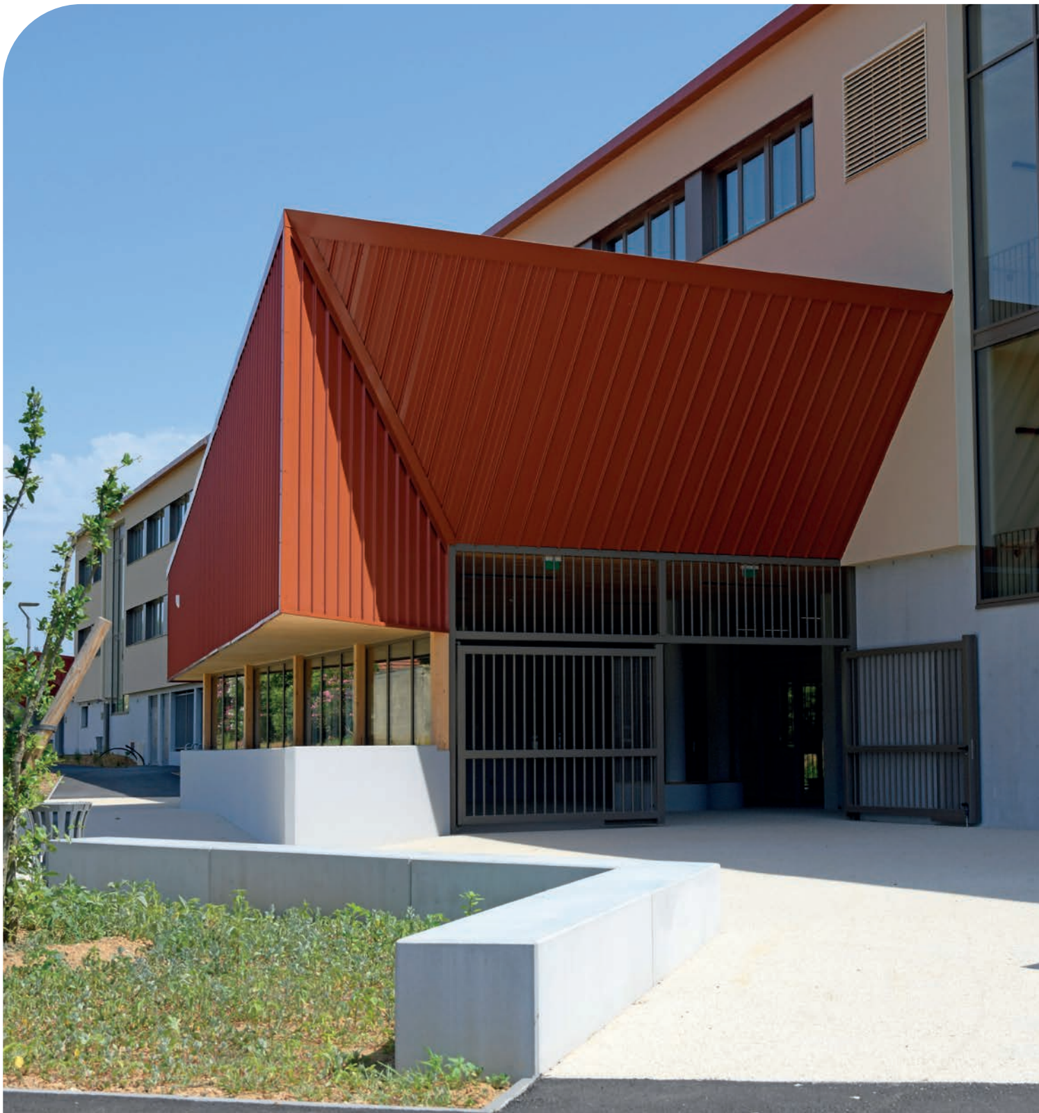
ENTRÉE DU COLLÈGE DÉPARTEMENTAL DE L'HERMITAGE