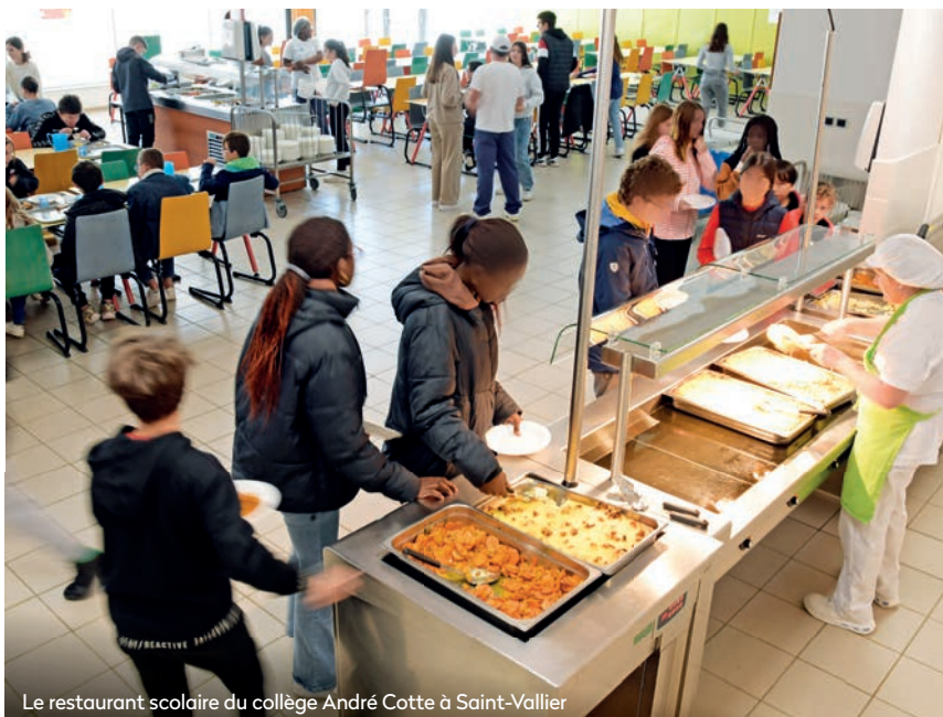
Le restaurant scolaire du collège André Cotte à Saint-Vallier