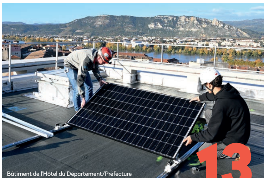
Bâtiment de l'Hôtel du Département/Préfecture