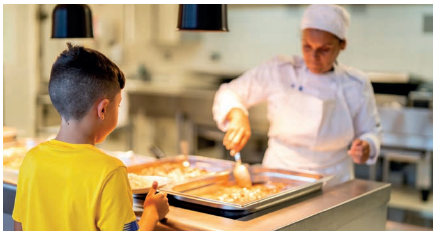
Collège départemental de l'Hermitage, Mercuriol-Veaunes