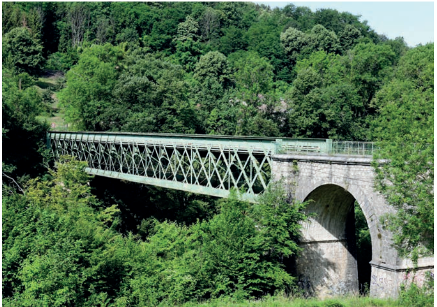
Le Pont du Tram

Le 23 juillet 2025, la Drôme retrouve le Tour de France ! Après un départ de Bollène, les coureurs traverseront la Drôme du sud au nord sur près de 150 km, avant d'arriver à Valence. Venez encourager les coureurs sur ce parcours presque entièrement drômois, qui met en valeur la beauté de notre territoire. Le Département soutient cet événement incontournable pour les passionnés de vélo.