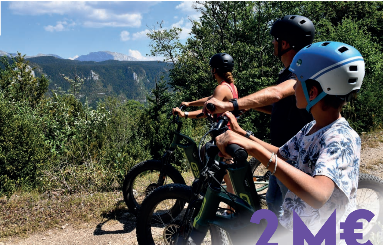
Balades en VTT et trottinettes électriques, Espace Raphaël Poirée

Des sensations fortes aux escapades nature, les stations de la Drôme innovent et s'engagent pour un été placé sous le signe du plaisir et du respect de la nature. Autant de nouveautés et animations qui font rimer montagne avec passion.