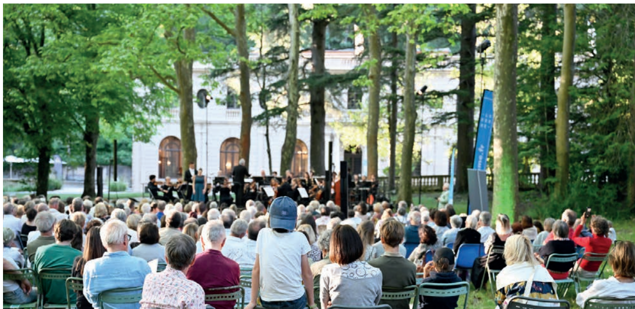
Festival Mozart dans la Drôme, Forêt de Saoû

Et si cet été, la Drôme devenait votre plus belle scène à ciel ouvert ? Festivals de musique, arts de rue, théâtre ou cinéma : la culture s'invite partout dans le département pour la saison estivale.