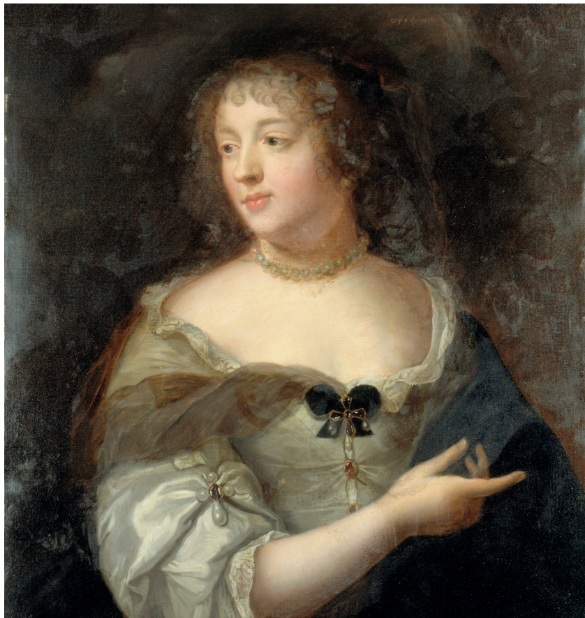
© Paris Musées/Musée Carnavalet - Lemeunier Basile, Peintre

A l'occasion du 400 e anniversaire de sa naissance, le Département de la Drôme - en collaboration avec la commune de Grignan et de nombreux partenaires - se mobilise pour lui rendre hommage au travers d'une année exceptionnelle. Une invitation à redécouvrir la marquise et la vie au 17 e siècle par une programmation riche et vivante : expositions, reconstitutions, gastronomie, ateliers d'écriture, visites et animations pour tous à Grignan, au château, à Valence et dans les médiathèques départementales.