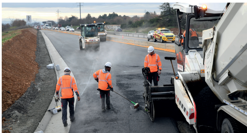
Chantier de l'échangeur de Montélier, le 11 décembre 2025