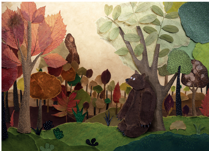
« L'ours qui n'en était pas un », une co-production Koma-Inu / Folimage