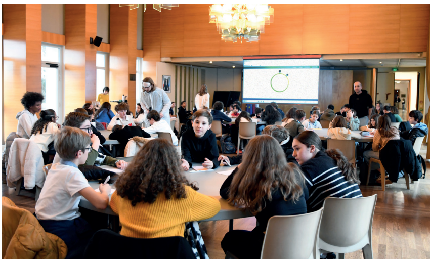
Ateliers lors de la séance d'installation des nouveaux jeunes élus, le 3 décembre 2025. Hôtel du Département, Valence

→ Toutes les infos sur recrutement-et-alternance-drome-ardeche.fr