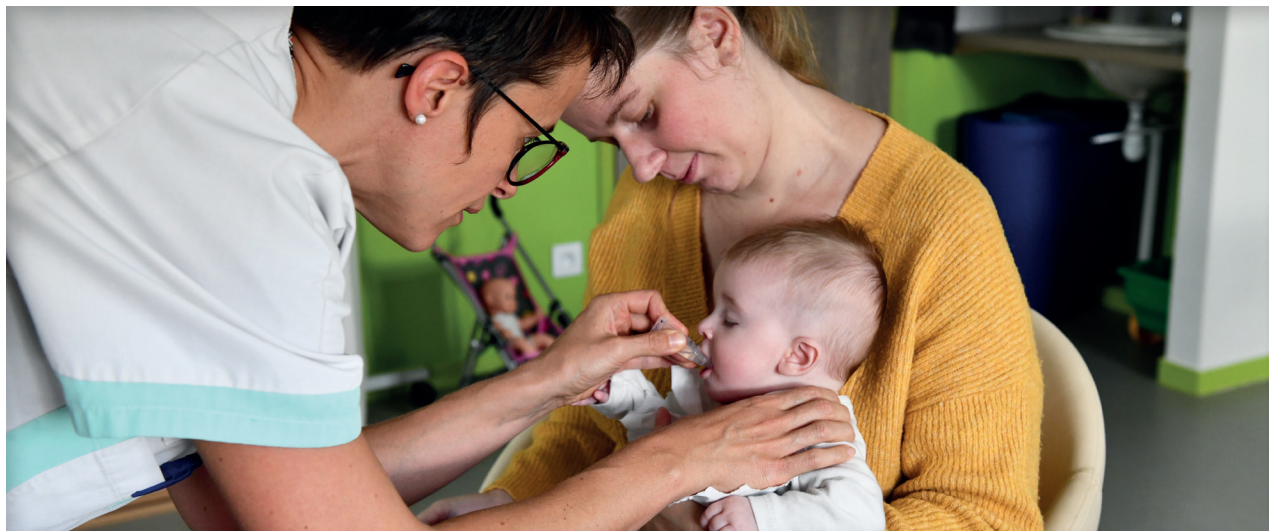
Médecin de la Protection Maternelle et Infantile

Depuis 1945, la Protection Maternelle et Infantile (PMI), service départemental gratuit et ouvert à tous, accompagne les parents et veille à la santé des tout-petits.