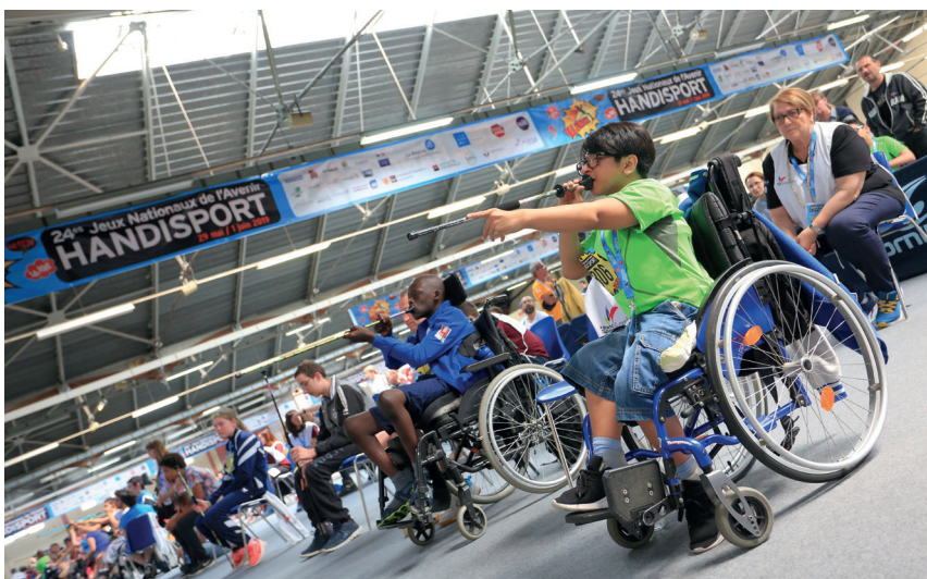
Jeux nationaux de l'avenir handisport à Valence, édition 2019.

→ Billetterie et programmation sur festivalmozart.fr