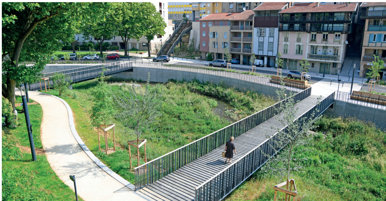
Réaménagement de la rivière Savasse, Romans-sur-Isère.

Acteur clé de l'aménagement local, le Département de la Drôme soutient les communes et intercommunalités dans leurs projets. Un engagement concret pour accompagner le développement des territoires et répondre aux besoins des habitants.